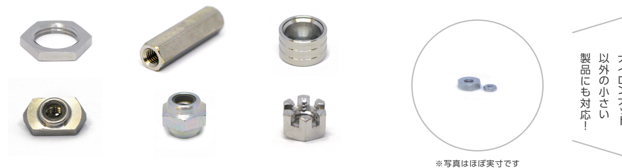
※写真はほぼ実寸です